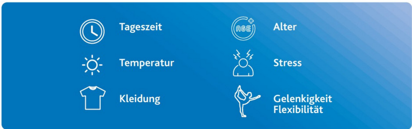
Abbildung 17: Einflussfaktoren auf die Beweglichkeit – personenexterne Faktoren (links) und personeninterne Faktoren (rechts).